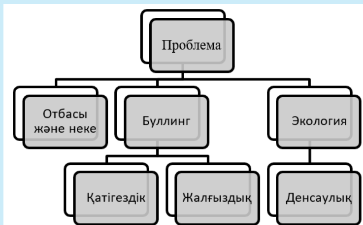
3-сурет – Әңгімедегі өзекті проблемалар

Зерттеудің негізгі объектісімен жұмысты жалғастыру үшін сауалнаманың келесі нәтижелері назарға алынды. Мектеп оқушысын қандай да көркем шығарманы оқуға ынтықтырудың бір жолы – spoiler, яғни ең дәмді тұстарынан кішігірім ақпарат беру. Бұл тұжырымды сауалнамаға қатысушылардың 59%-ы растады. Оқиғаның одан ары қалай өрбіп, немен аяқталғанын білуге ұмтылған оқушы туындыны бір деммен оқып шығары сөзсіз. Дәл осындай ерекше атауымен, қиял-ғажайып элементтері аралас сюжетімен және астарлы идеясымен оқушыны елітіп әкететін әңгімелердің бірі – «Қоңырқаз». Автор бұл әңгімесінде бүгінгі қоғам үшін өзекті бірнеше проблемаларды көтерген: